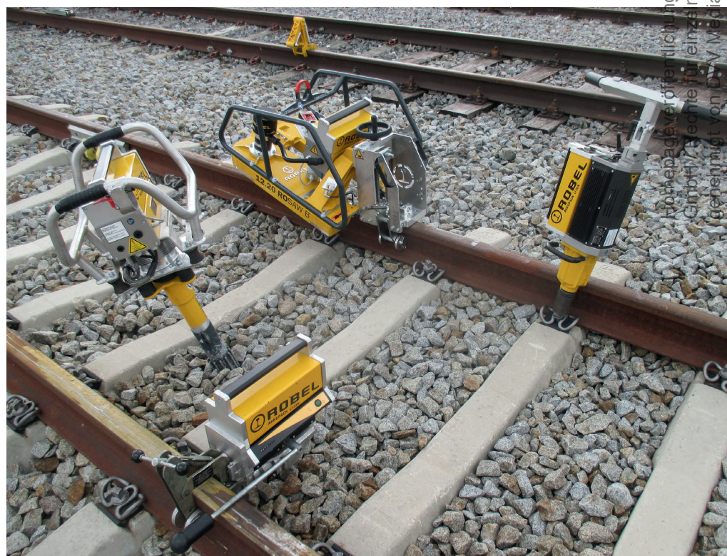
Abb. 1: Alle vier Maschinentypen der Robel Akku-Familie werden mit dem gleichen Lithium-Ionen-Akku betrieben.

Mit der Substitution von Verbrennungsmotoren durch Akku-gestützte Elektromotoren eröffnen sich insbesondere bei Arbeiten im Tunnel und im urbanen Umfeld (U-Bahn, Stadtverkehrsnetze) neue Möglichkeiten mit spürbaren Verbesserungen für den Bediener und die Umwelt. Die Maschinen sind leicht, leise, emissionsfrei und in jeder Umgebung einsetzbar. Das bei reinen Elektroantrieben notwendige, zeitintensive Verlegen von Stromversorgungskabeln – im Tunnel üblicherweise von zwei zusätzlichen Personen ausgeführt – sowie das Aufstellen von Stromaggregaten entfallen, ebenso die Bewetterung und die damit verbundenen Gesundheitsbeeinträchtigungen und Kosten. Die Schieneninstandhaltung wird schneller und effektiver, die Aufwände pro Baustelle werden deutlich geringer, die Mitarbeiterzufriedenheit steigt.