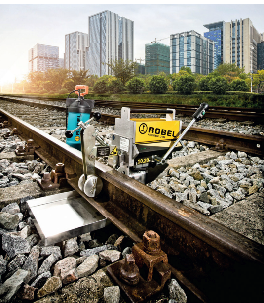
Abb. 3: Der Griff des Akkupacks ist gleichzeitig Tragegriff der RODRILL B Bohrmaschine.

Alle Maschinen der Akku-Familie arbeiten mit dem gleichen Akkupack, einem im jahrelan-