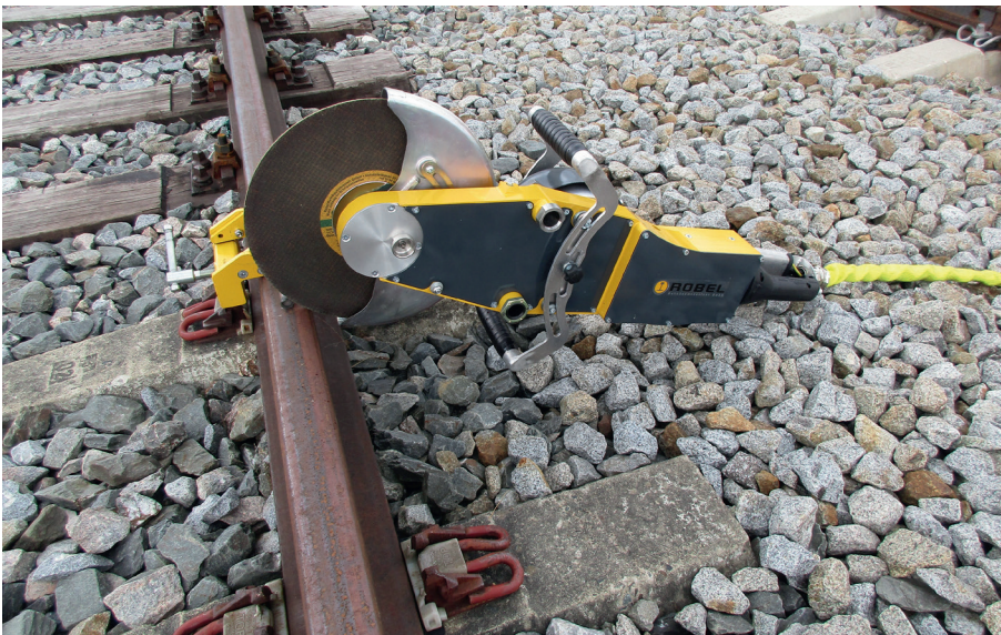
Abb. 2: Leistungsstarkes Leichtgewicht: Das neue Rocut B Schienen-Trennschleifgerät schafft 50 Schnitte mit einem Akku.