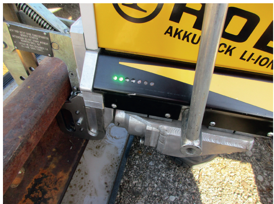
Abb. 5: Elektronisch unterstütztes Arbeiten: Die LED-Anzeige der Akku-Schienebohrmaschine signalisiert die Höhe der Leistungsabgabe beim manuellen Vorschub.

Die beim Akkupack eingesetzten Zellen sind nicht brennbar und damit für hoch sensible Be-