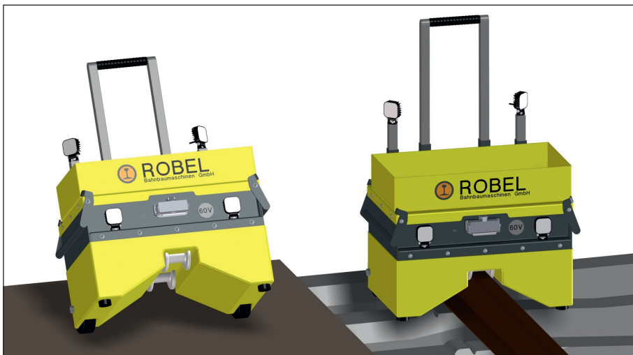
Abb. 6: Der 2-Wege-Trolley ermöglicht den Transport von Akku und Zusatzmaterial auf der Schiene und im Gelände.