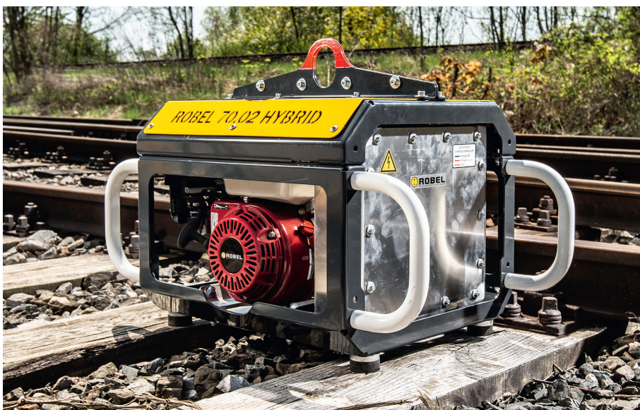
Abb. 8: Tragbare Lösung: Die Versorgung der ROGRIND HF Head Hochfrequenz-Schleifmaschine erfolgt über ein separates Powerpack.